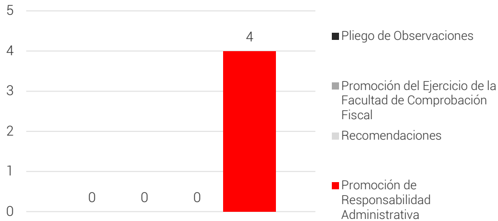
Resumen de las Acciones Derivadas de las Observaciones

Como resultado de los procedimientos de auditoría se emitieron observaciones por las cuales el ente auditado proporcionó documentación. En ese sentido, se presenta a continuación una síntesis de las justificaciones y aclaraciones presentadas por la entidad fiscalizada, la acción que, en su caso, se promueve como consecuencia de la no atención de las observaciones y el estatus de las mismas.